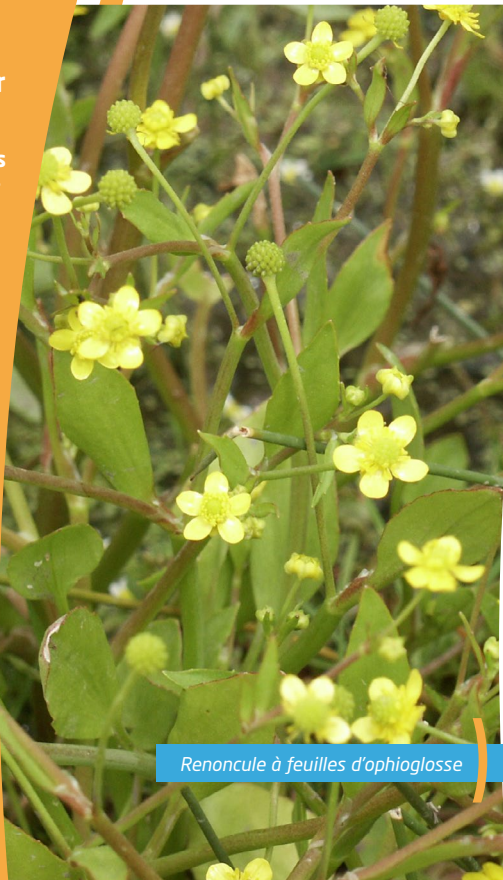
Renoncule à feuilles d'ophioglosse

• On dénombre 198 espèces végétales, dont 25 peuvent être considérées comme remarquables. Cinq d'entre elles sont d'ailleurs protégées, au plan national comme la Renoncule à feuilles d'ophioglosse , ou régional comme le Trèfle de Michéli , l' Iris bâtard , la Cératophylle submergée et la Cardamine à petites fleurs .